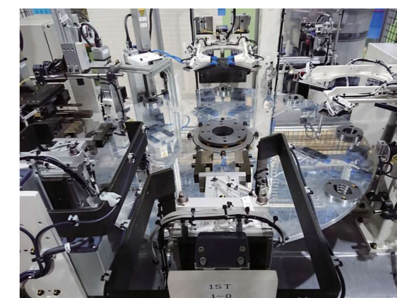
インデックス式のOリング組付け機