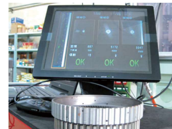
高感度カメラで穴の数量、大きさを判別