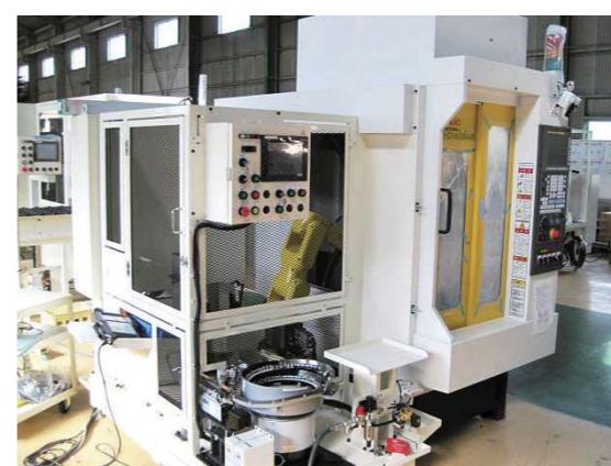
ロボット・ロボドリルを組み合わせた自動化