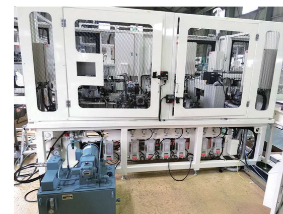
カムシャフトのインライン式油圧圧入機