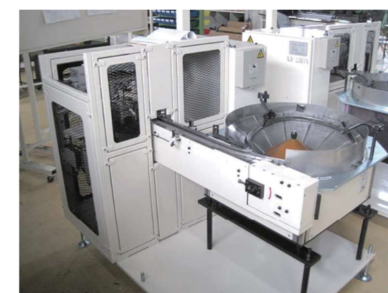
無振動式ボールフィーダ 材料供給装置