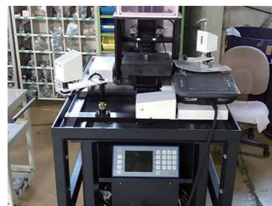
精密測定器を使った計測ユニット