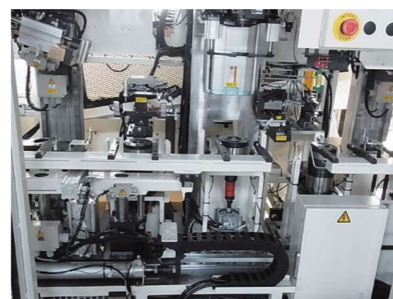
精密計測機器を使ってミクロン単位の測定