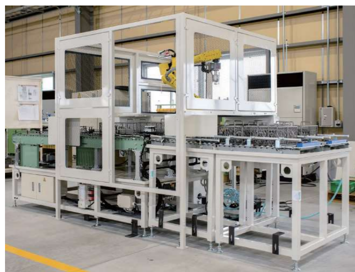
加工機に合わせて供給～搬出まで自動化