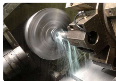
切削加工により発生する切粉