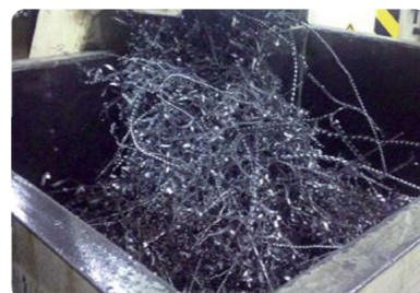
旋盤から機外へ排出