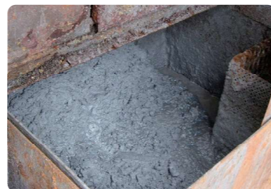
研磨スラッジ保管場は場所を取り、 土壌汚染の心配も