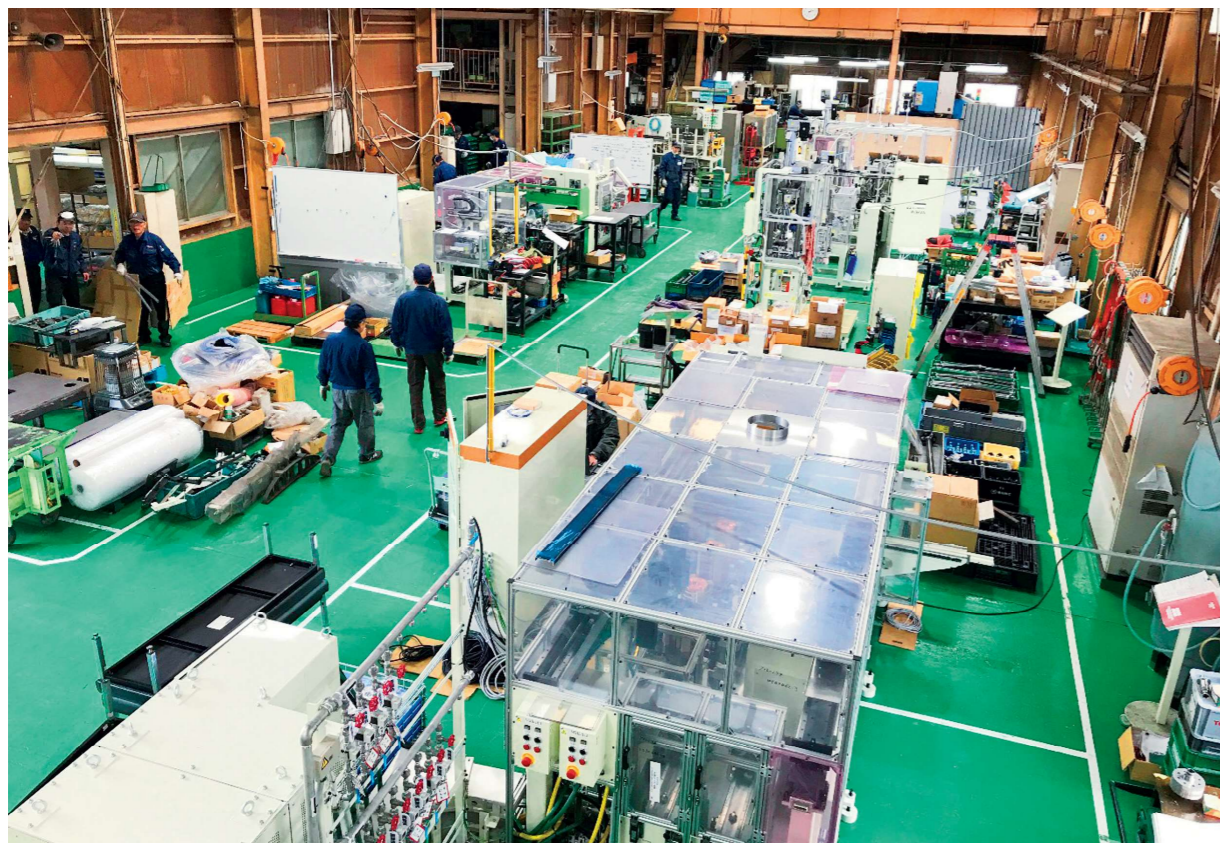
本社 組み立て工場