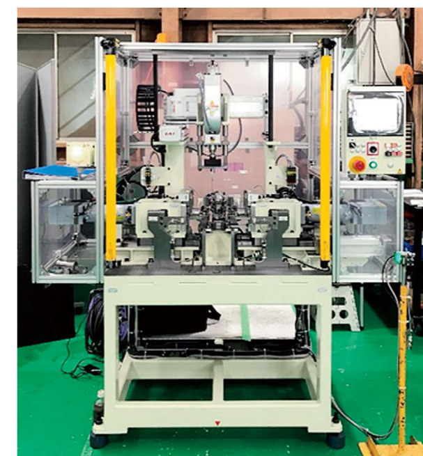
ジョイントS圧入機