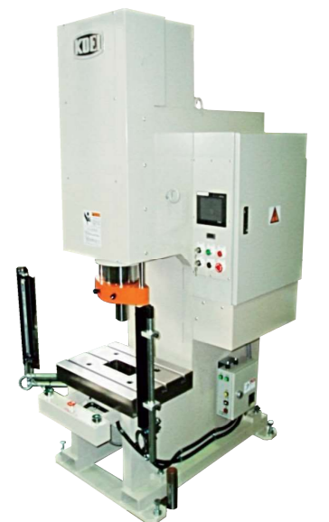
油圧サーボプレス30TON KUS-30