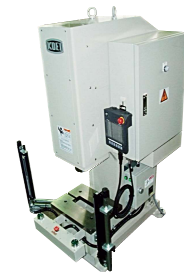
電動サーボプレス 5TON KSV-5