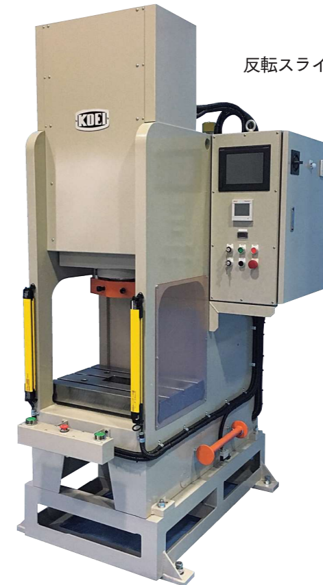
高速油圧サーボプレス