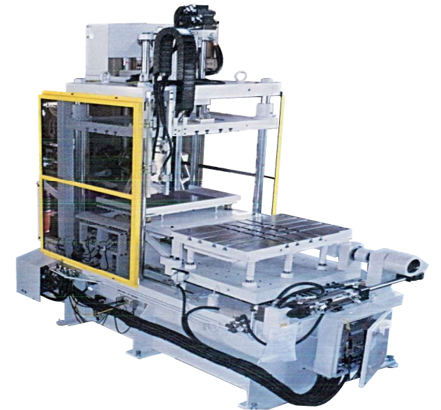
反転スライドテーブル付油圧トリミングプレス30TON