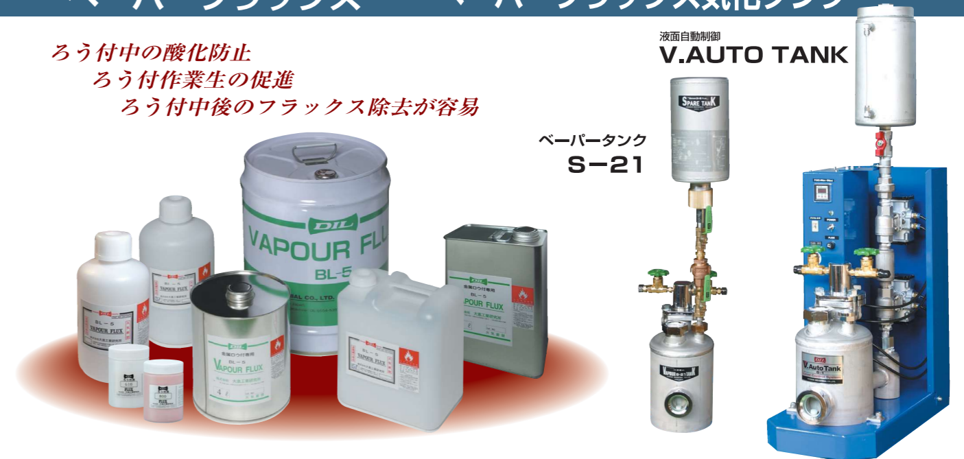
液面自動制御 V.AUTO TANK