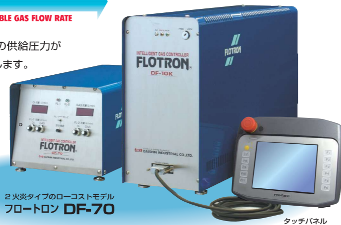
2火炎タイプのローコストモデル フロートロン DF-70

又、30種類の加熱条件が設定でき、タッチパネル操作盤の画面からの操作により、流量設定やワークの機種別の流量段階操作が簡単にワンタッチで出来ます。