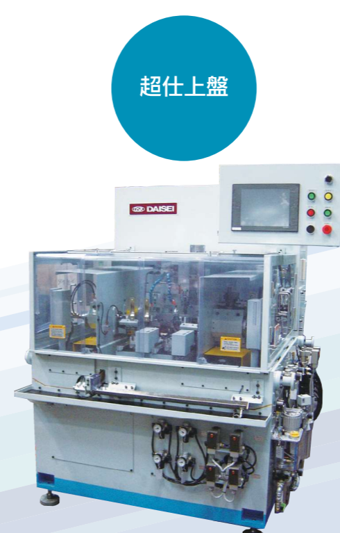
横形2軸シリーズ超仕上盤