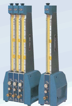
空気マイクロメータ