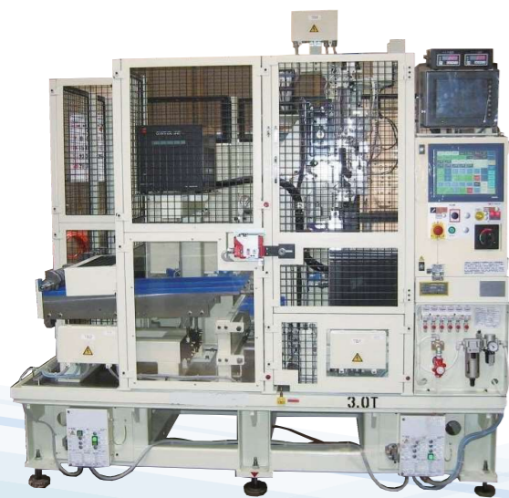
クランクシャフト用自動計測機