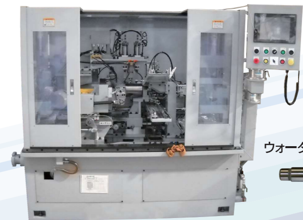
ウォーターポンプ用超仕上盤